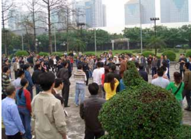
公安と談笑していた学生風の若者が南大門前広場で氣勢を上げ始める、