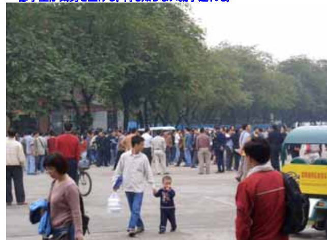
一部学生が気勢を上げる。何も知らない親子連れも。