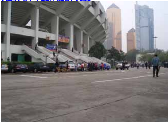
大型のシェパードを連れて巡回する公安。