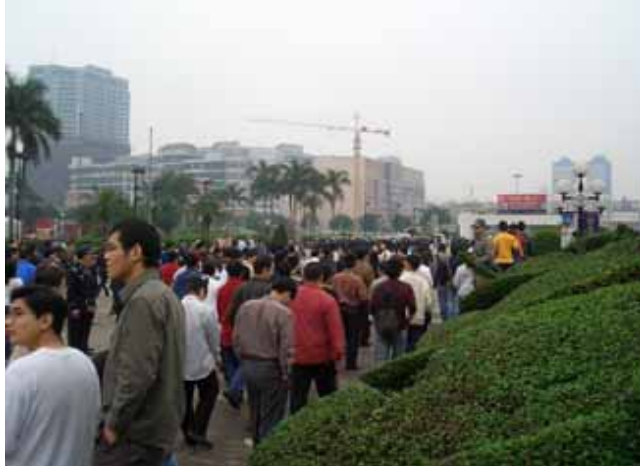
集まる野次馬、学生風の若者の動きに合わせて動きはじめる、