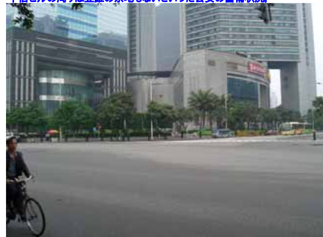
中信ビルの周りは立錐の余地もないといった公安の警備状況。