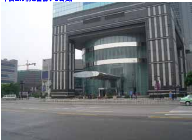
中信ビル前を警備する公安。