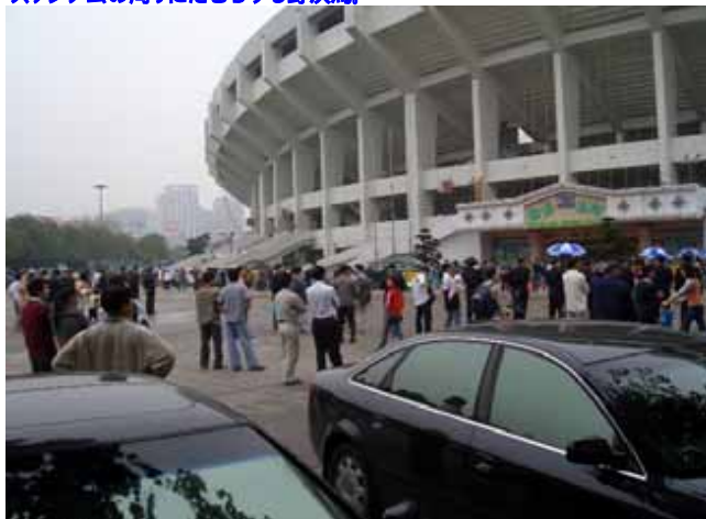
スタジアムの周りにたむろする野次馬。