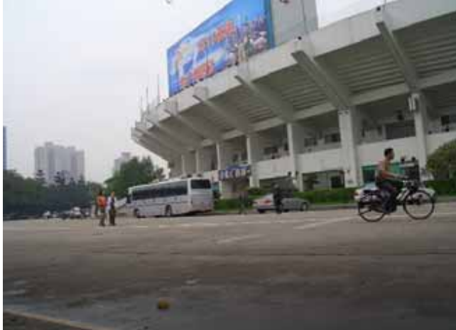
屋根にはアンテナ、横には「公安指揮車」と大書された車が威嚇、