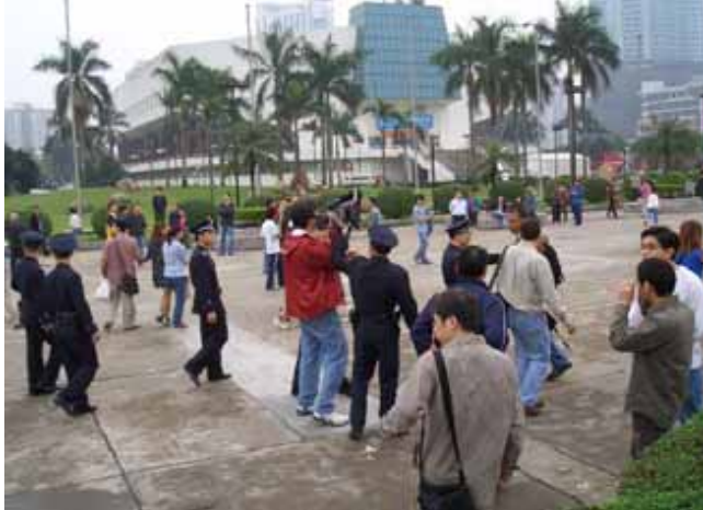
ビデオ撮影する赤いパーカーの男を制止する公安、