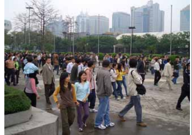
走って集まり始める野次馬、同時に集合する公安、