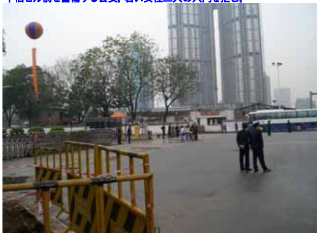
中信ビル前を警備する公安。若い女性二人の入門を拒む。