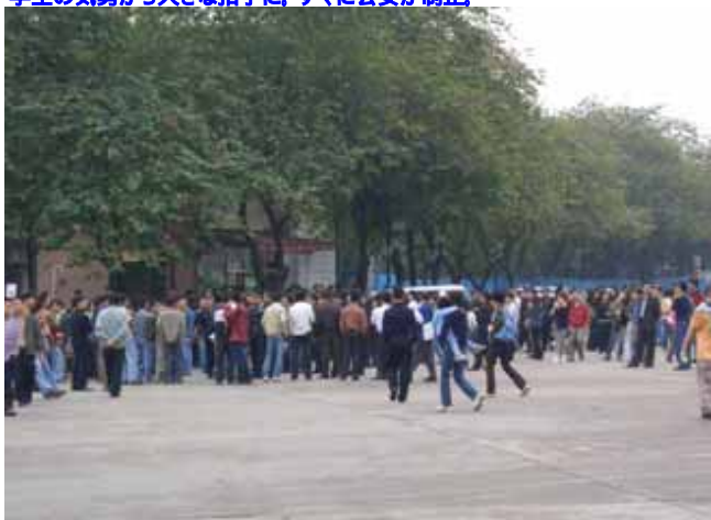
学生の気勢から大きな拍手に、すぐに公安が制止。