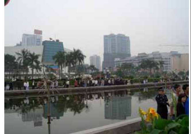
公安の本格制圧行動開始、広場の外に野次馬を追い出す、