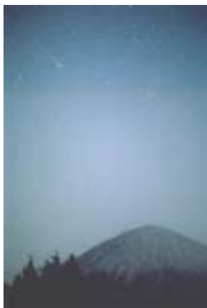
優秀賞 「池谷・張彗星」