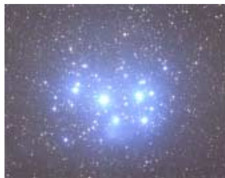
優秀賞 「プレアデス星団(すばる)」