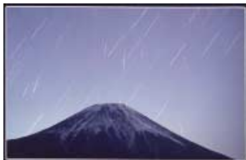
佳作 「しし座流星群と富士2001」