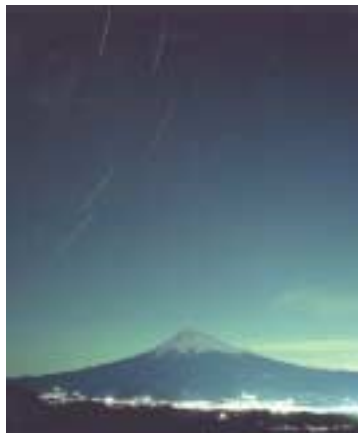
奨励賞 「昇る北斗 (春)」