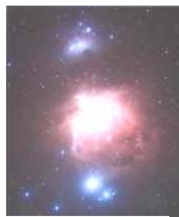
奨励賞 「オリオン大星雲」