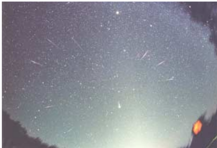
最優秀賞 「しし座流星群」