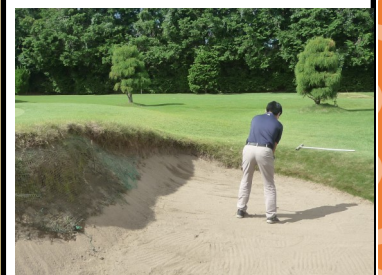
バンカー&ショートゲーム