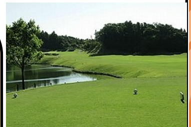
コースマネジメント